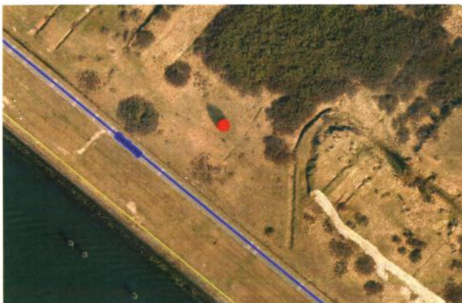
● Rooien boom